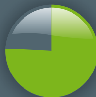
Par mode d'admission en 2008