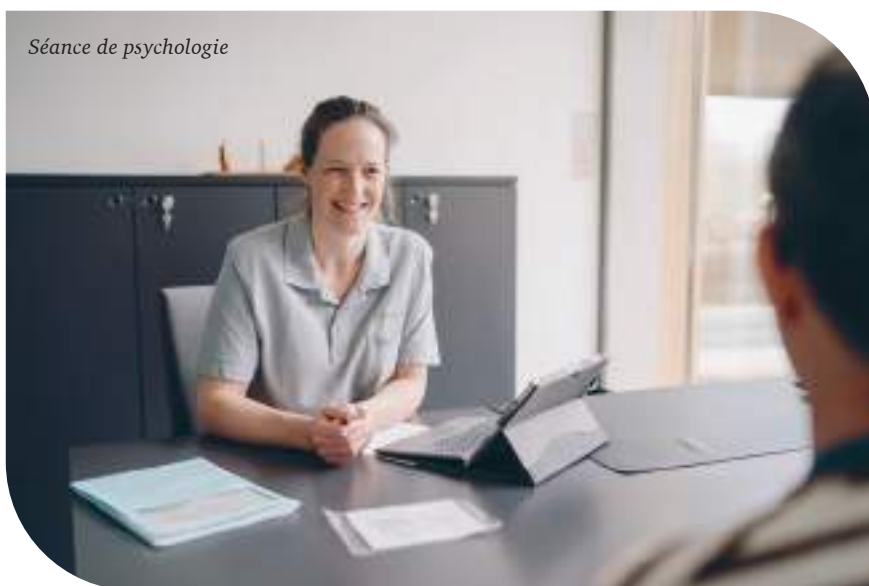
Séance de psychologie

Le responsable d'unité , garant du bon fonctionnement de l'unité dans laquelle vous vous trouvez, est aussi votre interlocuteur privilégié.